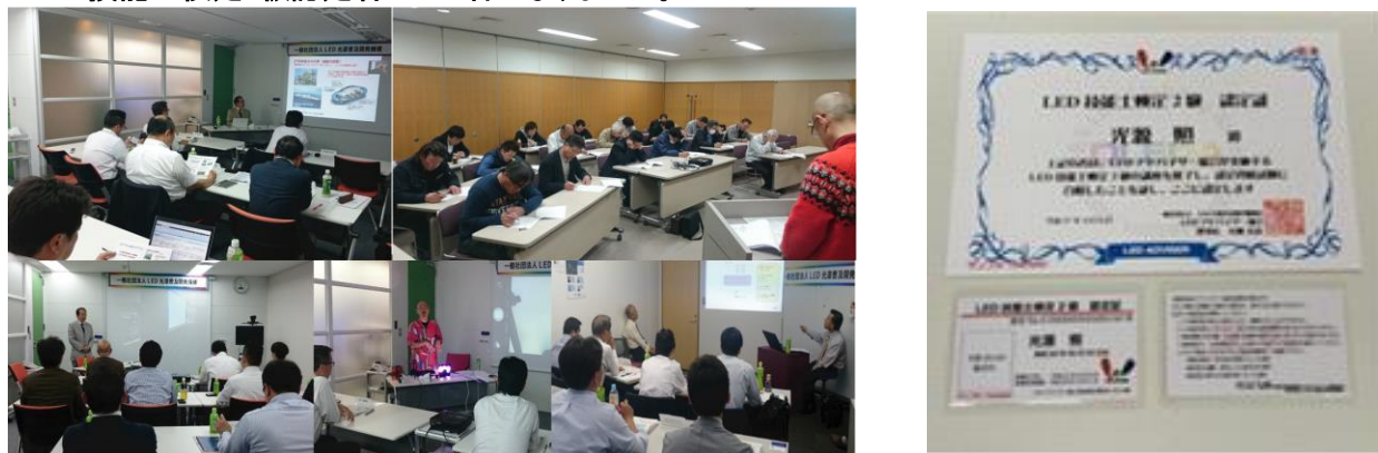
【写真：第8回～9回LED技能士検定授業風景/LED技能士2級検定認定書/認定パス】