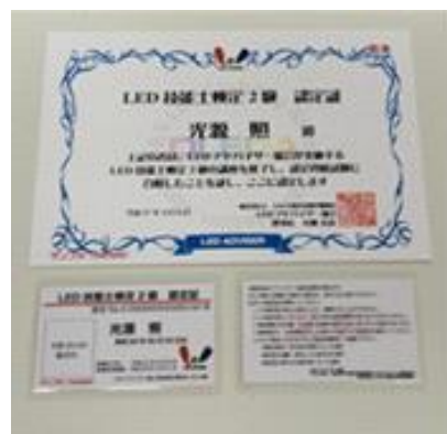
写真②LED技能士2級検定認定書/認定パス】