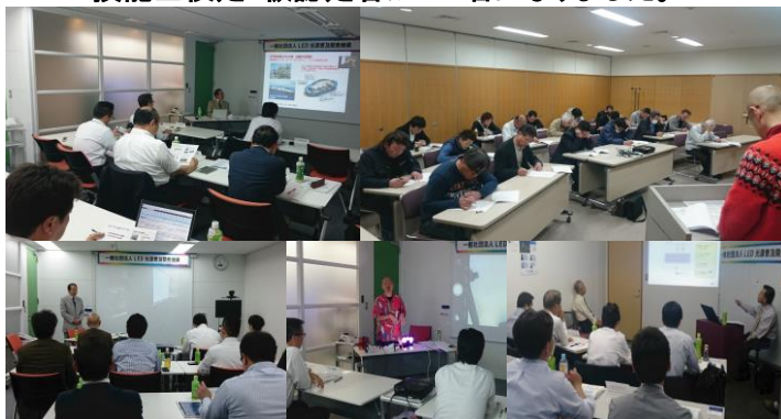
【写真①】:LED 技能士検定授業風景