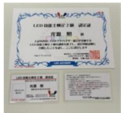
写真②: LED技能士2級検定認定書/認定パス