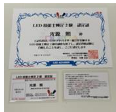
②LED 技能士2級検定認定書/認定パス