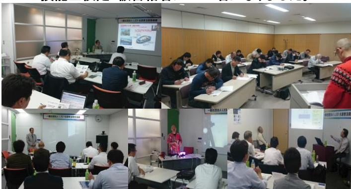
【写真①】:LED 技能士検定授業風景