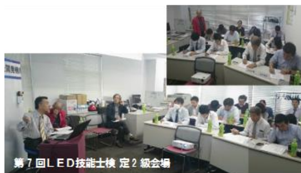
第7回LED技能士検定2級会場