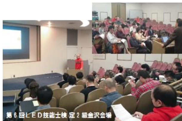
第6回LED技能士検定2級金沢会場

2級検定のため、まったく LED 光源(照明)の知識のない方も多く、検定試験への不安をお持ちでしたが分かり易いテキストとベテランの講師陣の説明で、各会場共検定試験を無事パスされ、これまでに多くの方々が LED 技能士検定2級資格者として認定されています。