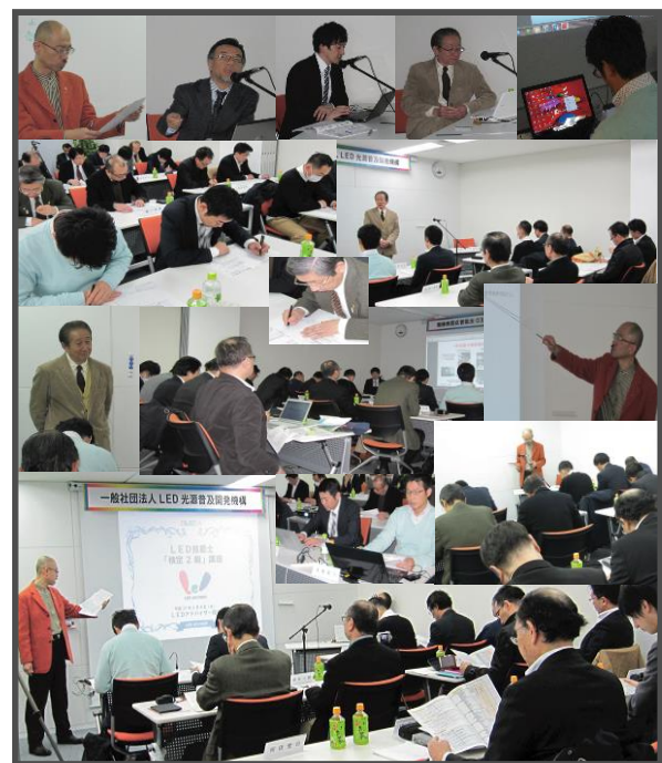
【写真:LED 技能士検定第1～第5回抜粋写真】

2級検定のため、まったく LED 光源(照明)の知識のない方も多く、検定試験への不安をお持ちでしたが分かり易いテキストとベテランの講師陣の説明で、4会場共検定試験を無事パスされ、これまでに多くの方々が LED 技能士検定2級資格者として認定されています。