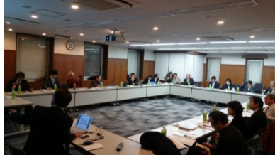
【第3回異業種交流会】