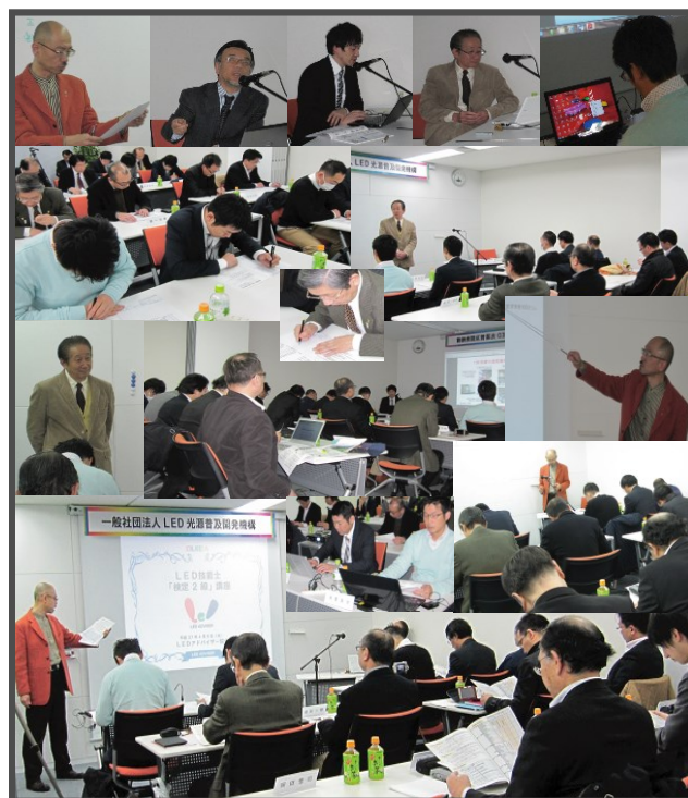
【写真:LED 技能士検定第1~第3回抜粋写真】

2級検定のため、まったく LED 光源(照明)の知識のない方も多く、検定試験への不安をお持ちでしたが分かり易いテキストとベテランの講師陣の説明で、3会場共検定試験を無事パスされ、これまでに多くの方々が LED 技能士検定2級資格者として認定されています。